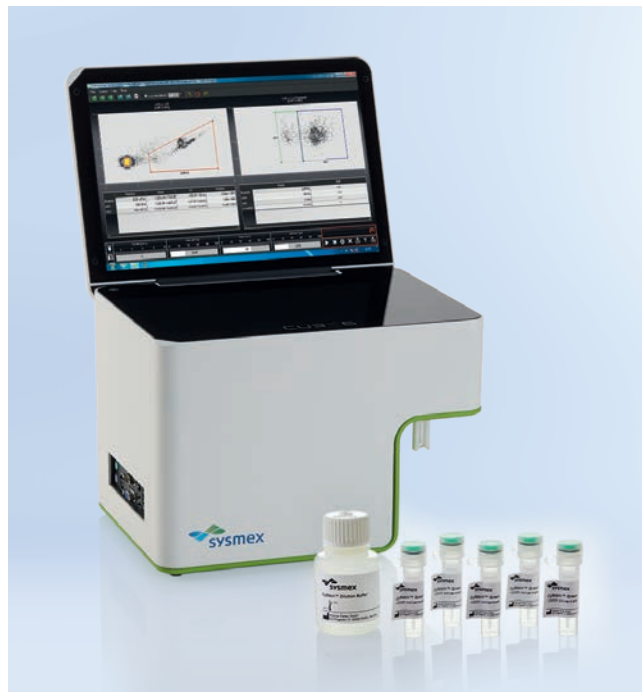
CyFlow Cube 6 V2m und CyStain BacCount Total Kit

Mithilfe des CyStain BacCount Total Kits bestimmen Sie schnell und einfach die Gesamtzahl der Bakterien in Wasserproben, was entscheidend zur Beurteilung des mikrobiellen Status von Prozesskontrollproben ist. Um den physiologischen Zustand bestimmen können, nutzen Sie zusätzlich das CyStain BacCount Viable Kit zur Unterscheidung zwischen lebenden und toten Mikroorganismen. Beide Kits sind für die Qualitätskontrolle von wasserbasierten Proben aus unterschiedlichen Quellen konzipiert und für Hochdurchsatzmessungen optimiert – innerhalb von nur 15 min liegen Ihnen die Ergebnisse vor.